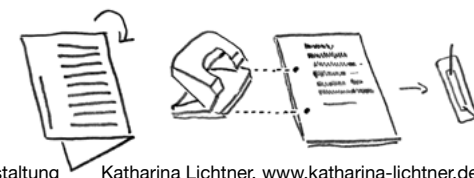
Gestaltung Katharina Lichtner, www.katharina-lichtner.de